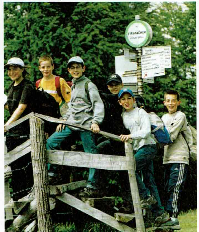
Un héritage précieux

Il était donc devenu urgent de préserver quelques espaces sensibles pour les générations futures et de montrer que l'on peut vivre avec la nature sans devoir la dominer absolument car nous avons besoin d'elle; on a alors créé les réserves naturelles (une centaine depuis 1957), les parcs nationaux (une dizaine depuis 1960) et les parcs régionaux (une trentaine depuis 1967).