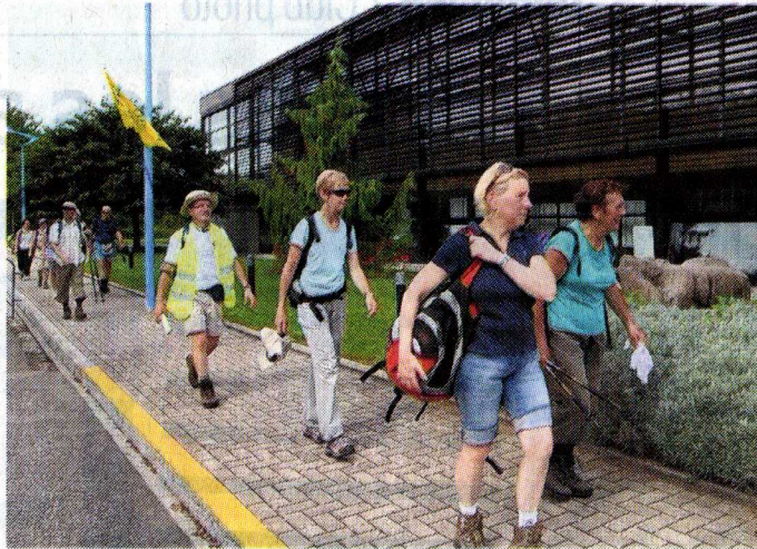
Les randonneurs ont marché une dizaine de kilomètres entre Salmbach et la salle polyvalente de Lauterbourg.

■ Une marche transfrontalière, puiser l'eau de la Lauter pour ensuite l'acheminer jusqu'en Espagne: tel est l'esprit de l'Eurorand'Eau (lire également en pages Région), organisée hier par le Club vosgien de Wissembourg, sous l'égide de la fédération européenne de randonnée pédestre.