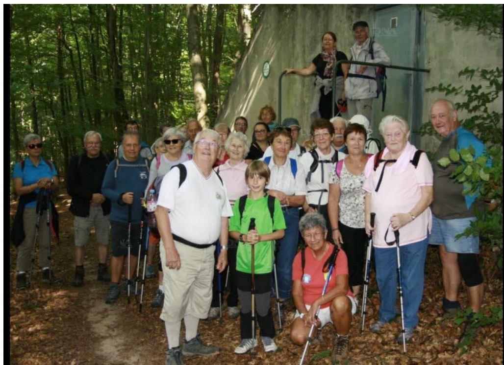
Le groupe de randonneurs a suivi le sentier balisé croix verte.

Il est rare que le Club vosgien de Haguenau bouleverse son programme de randonnées. Cela a pourtant été le cas, dimanche 20 août, en raison de la fête du 140 e anniversaire du Club vosgien de Wissembourg (CVW).